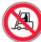
2.7. iekšējā transporta kustība aizliegta