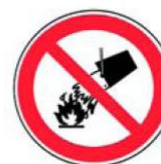
2.4. nedzēst ar ūdeni